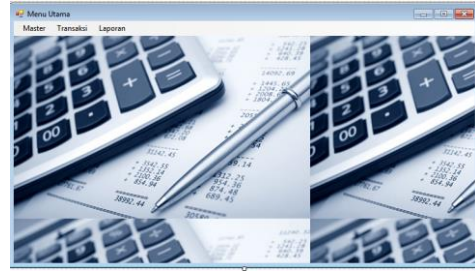
Gambar 2. Form Menu Utama

Form Menu Utama adalah menu pertama yang ditampilkan program pada saat dijalankan. Form Menu Utama tampil dengan beberapa tampilan menu di dalamnya yaitu Master, Transaksi, dan Laporan.